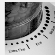
Настройка степени помола

Вкусы и предпочтения у всех разные, поэтому рекомендуем попробовать различные настройки помола в зависимости от степени обжарки кофейных зерен и индивидуальных предпочтений. В качестве ориентира предлагаем ознакомиться со следующей информацией: